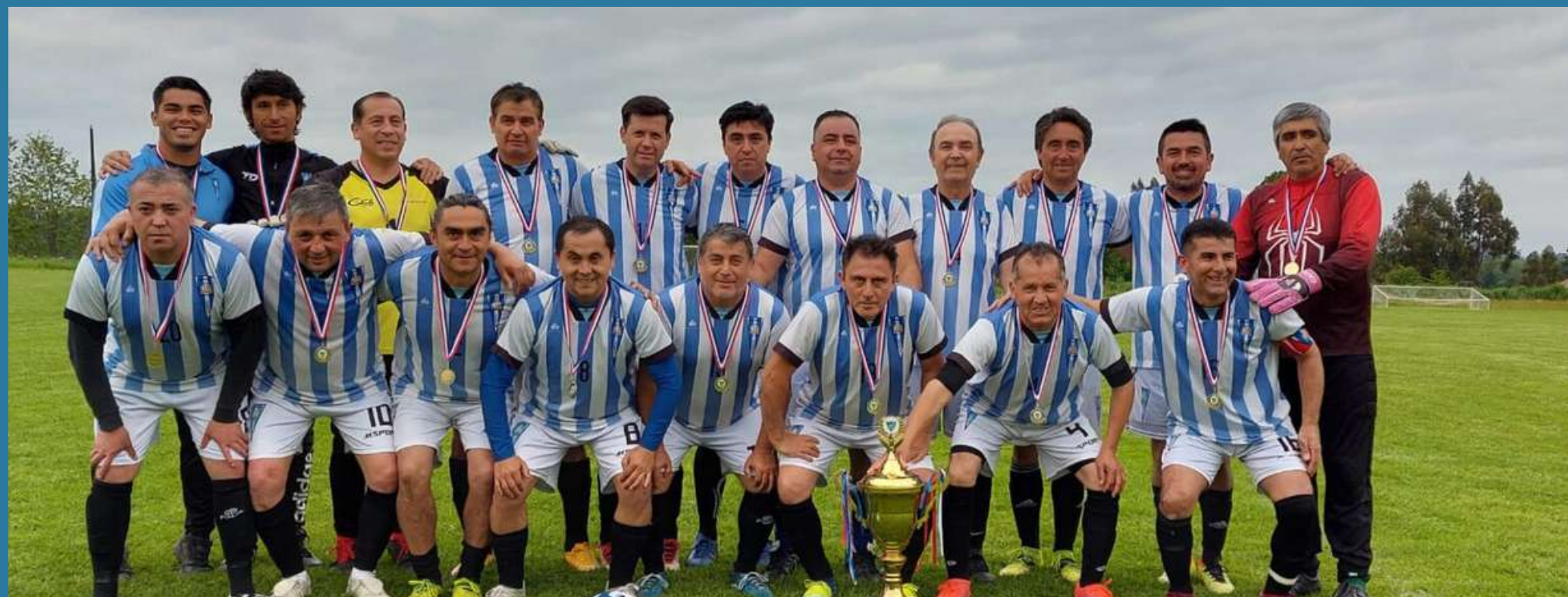
Súper Sénior A