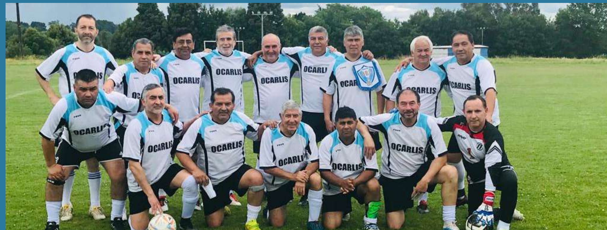
Súper Sénior B